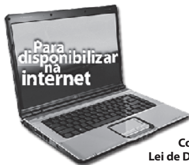
Cartilha sobre Direitos Autorais Convenção Universal Lei de Direitos Autorais/ Constituição

Agora você já sabe como ser um pesquisador. Pratique essa idéia em cada um de seus trabalhos acadêmicos, incluindo a sua monografia, e, para esclarecer qualquer dúvida quanto à forma correta de redação, converse com seu professor ou com a própria Comissão para Avaliação de Autoria.